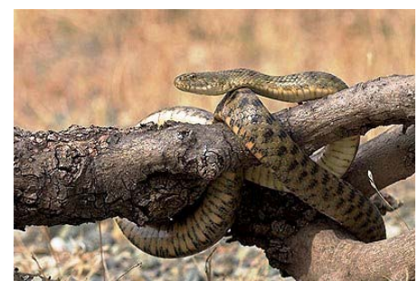
Die Abb. zeigen von li. nach re.: Mauergecko, Riesensmaragdeidechse und Würfelnatter.

Kontakt: Aquaworld Aquarium, Filikis Etirias 7, 70014 Limani Hersonissou, Crete.