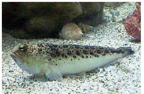
Die Abb. zeigen von li. nach re.: Riesenzackenbarsch, Schwarzgrundel und Petermännchen.