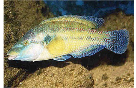
Die Abb. zeigen von li. nach re.: Muräne, Oktopus und Pfauenlippfisch